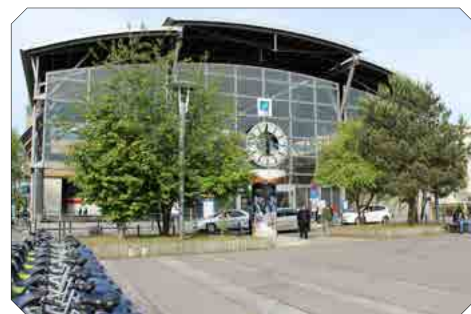
Gare (à 200 mètres)