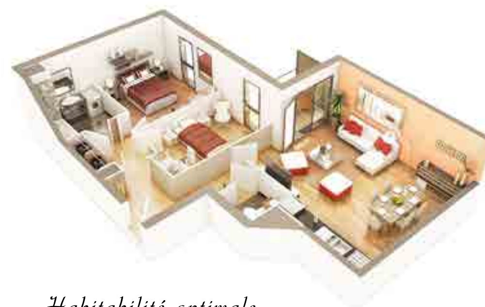
Habitabilité optimale Performances énergétiques