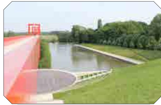
Dasselle de l'axe majeur