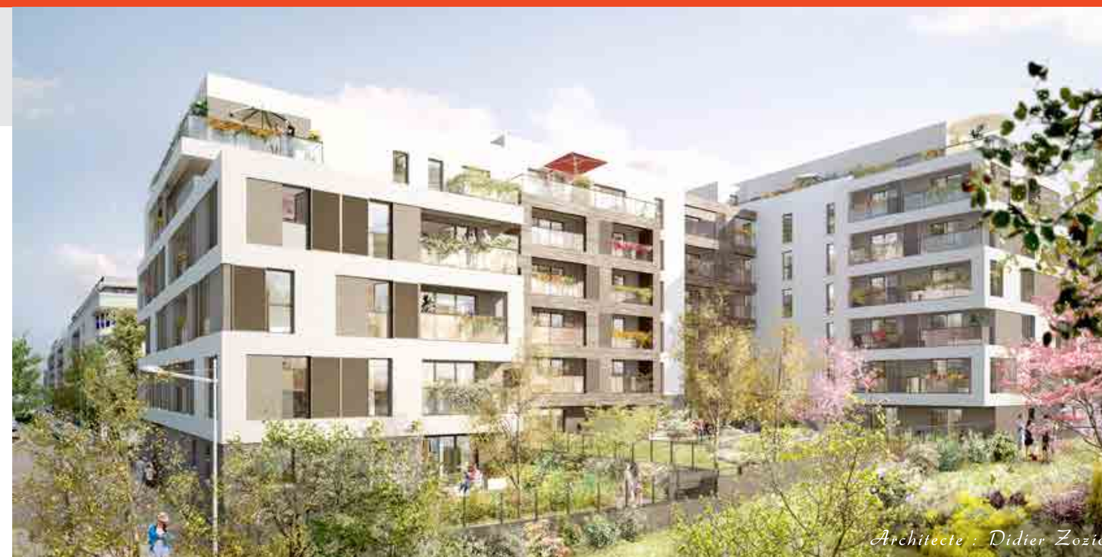
Architecte : Didier Zozió