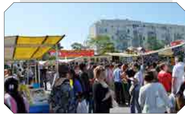
Marché des Hauts de Cergy

Par le soin apporté à la réalisation des espaces publics (rues, places, espaces verts, notamment la nouvelle place du Nautilus) et à leur entretien, le quartier des Hauts de Cergy forme un bel ensemble vivant, équilibré dans ses volumes et dans son fonctionnement, très attachant et agréable pour ses résidents.