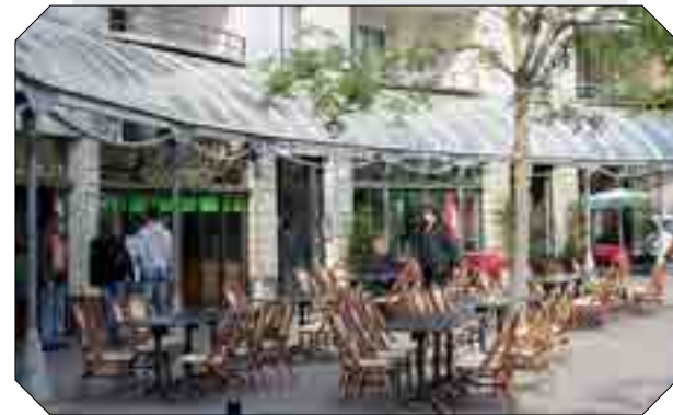
Une terrasse du quartier